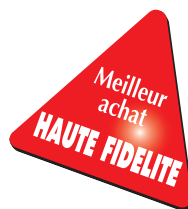
Figure de proue